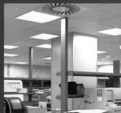
I.R.C.C.S. San Raffaele - Roma