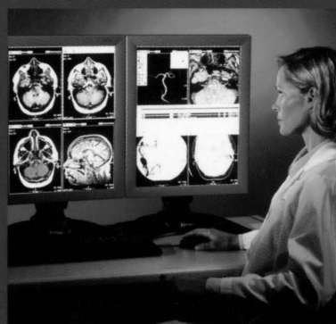
Sistemi Informativi PACS