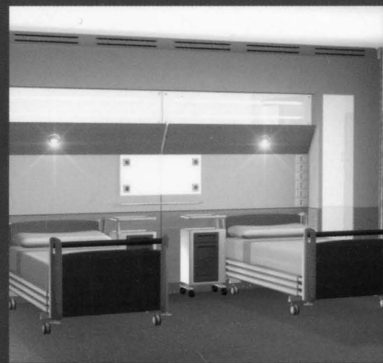
Polo Ospedaliero e Universitario - Udine

EDIFICI E TECNOLOGIE PER LA CURA, L'ASSISTENZA E LA RIABILITAZIONE